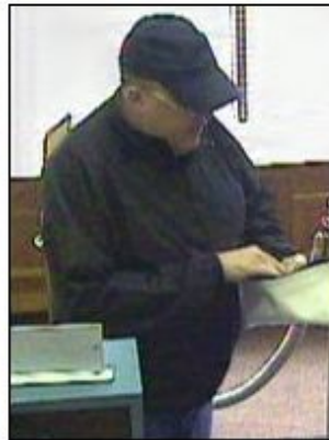
September 2009 New York