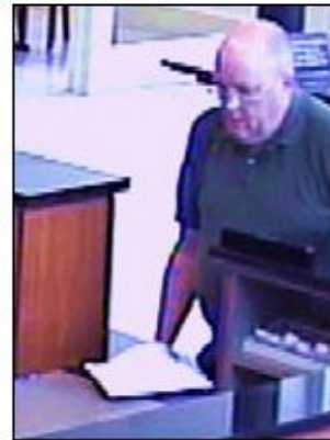
August 2009 Alabama