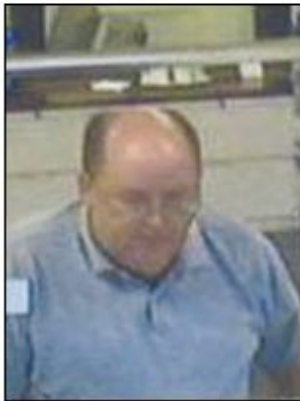
October 2009 Georgia